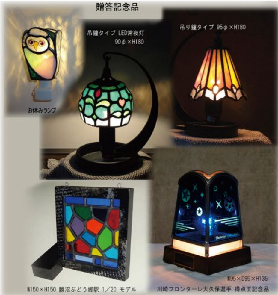
吊鐘タイプ LED常夜灯 90φ×H180