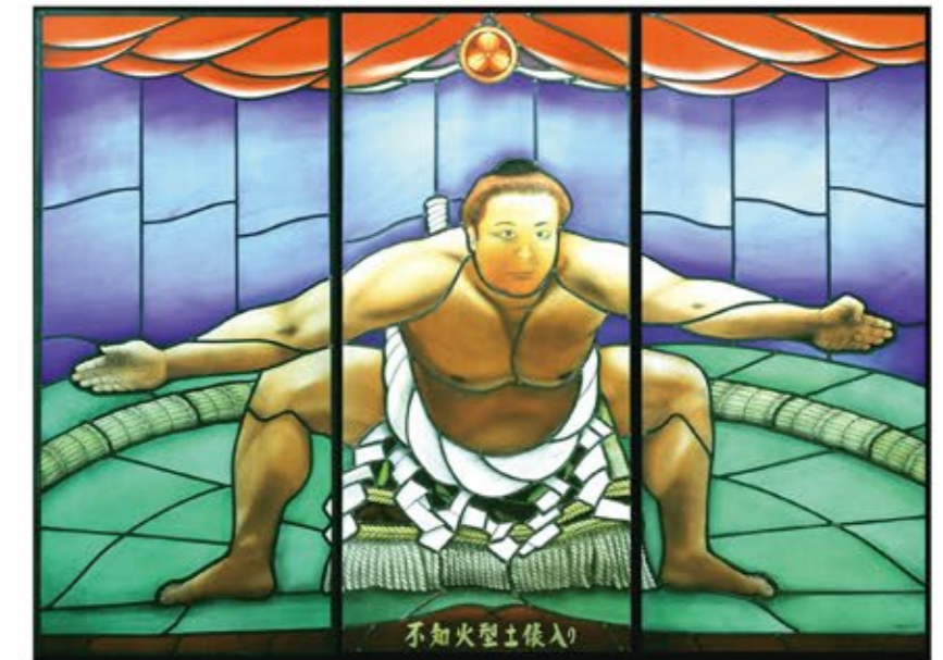
両国 割烹「吉業」1階内