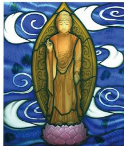
奈良県橿原市、正蓮寺庫裡阿弥如来図 (H 850 x W 720 2000年制作施工)