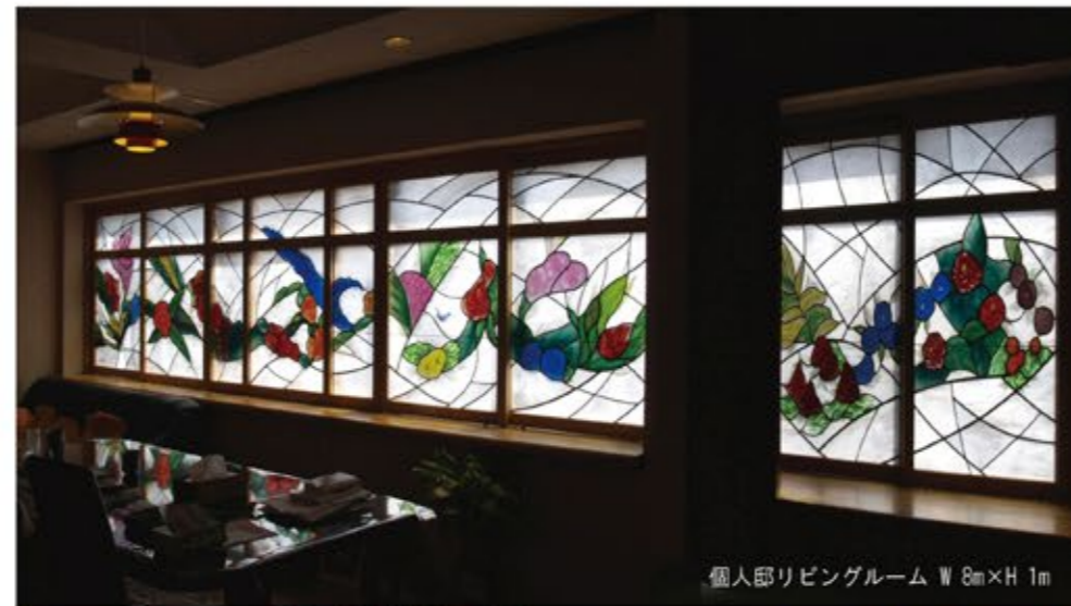
個人邸リビングルーム W 8m x H 1m