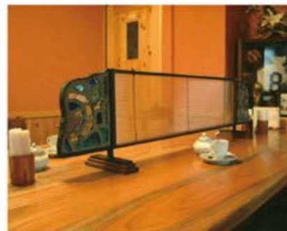
レストランテーブル間仕切り (ダルトペール、6φガラス管、銀鉄)