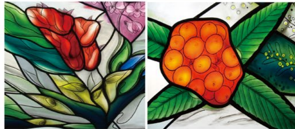
Copyrights (C) Tsuzuraya Studio 2017. All Rights Reserved