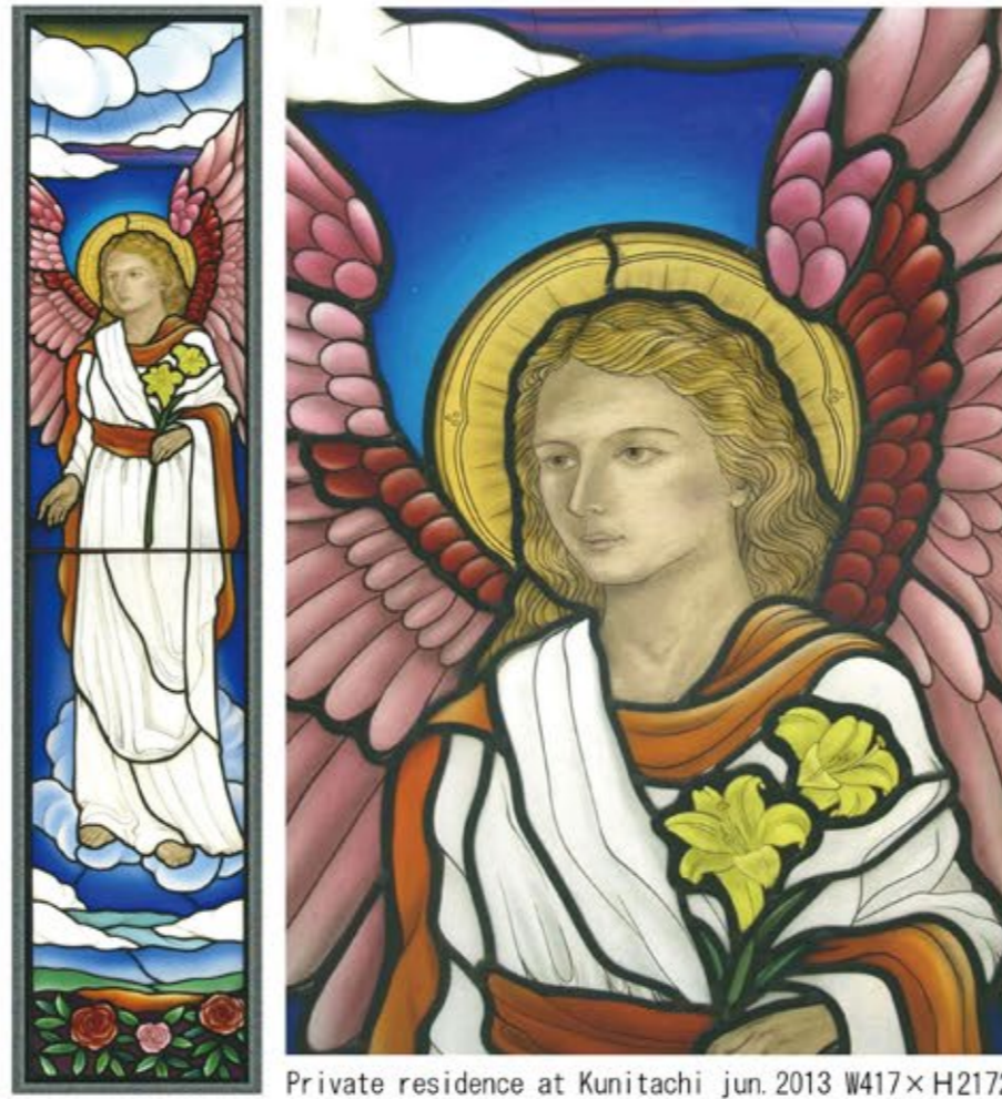
Private residence at Kunitachi jun. 2013 W417×H2172