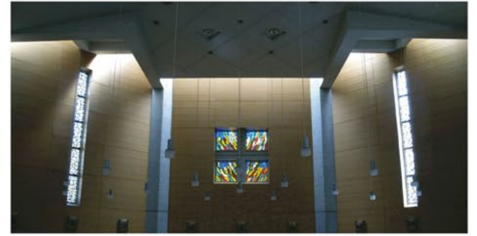
聖マリアンナ医科大学病院附属聖堂 1997年制作 (ダルトペール/絵付け)