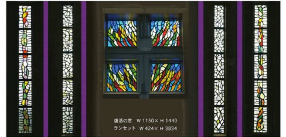
復活の窓 W 1150×H 1440 ランセット W 424×H 3834